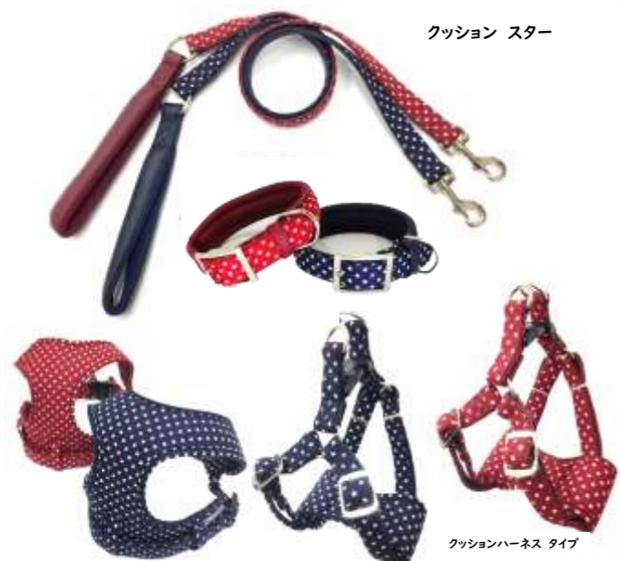
クッション スター