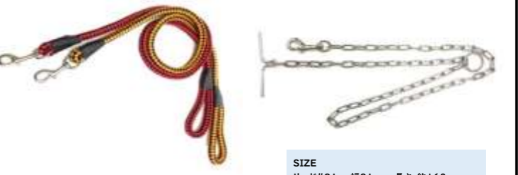
赤黒 (RBK) 黄黒 (YBK)

SIZE リード#21 幅21mm 長さ約160cm 小判鎖5.5 線径5.5mm 長さ200cm ステン鎖5.0 線径5.0mm 長さ200cm