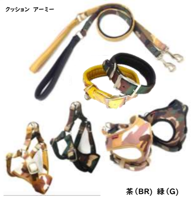
茶 (BR) 緑 (G)