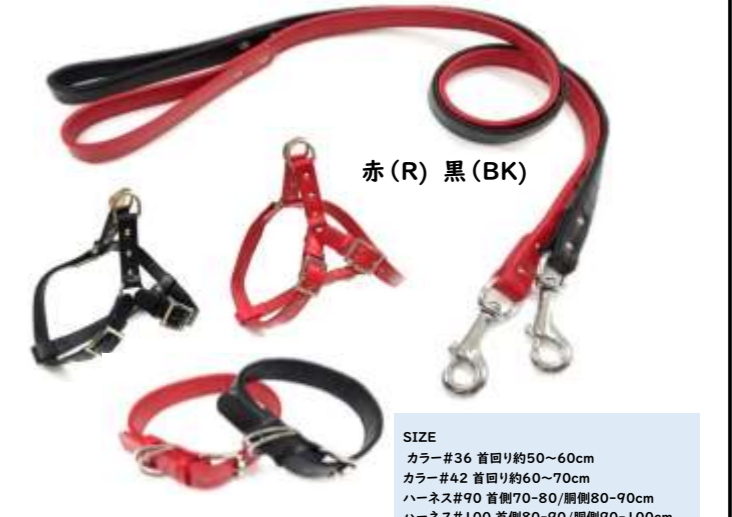
赤 (R) 黒 (BK)

SIZE カラー#36 首回り約50~60cm カラー#42 首回り約60~70cm ハーネス#90 首側70~80/胴側80~90cm ハーネス#100 首側80~90/胴側90~100cm リード#30 幅30mm 長さ約120cm