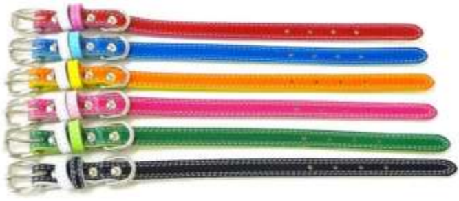
赤(R) 青(B) オレンジ(OR) ピンク(P) 緑(G) 黒(BK)