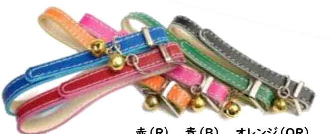
赤(R) 青(B) オレンジ(OR) ピンク(P) 緑(G) 黒(BK)