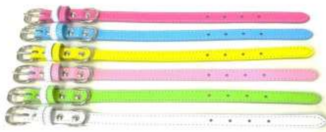
チェリー(CH) スカイ(SK) レモン(LE) ピーチ(PE) ライム(LI) ホワイト(WH)

当たり前のことですが、革は動物の皮膚でできており ワンちゃんたちの身体を覆う肌と同じものです。 肌荒れやアレルギーの防止にもなり、摩擦による 静電気が起きにくいので毛切れや、もつれ対策にもなります。