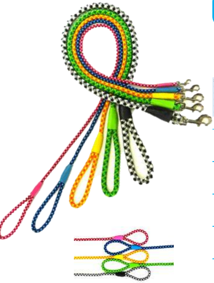
黒(BK) 青(B) 緑(G) 赤(R) 黄(Y)