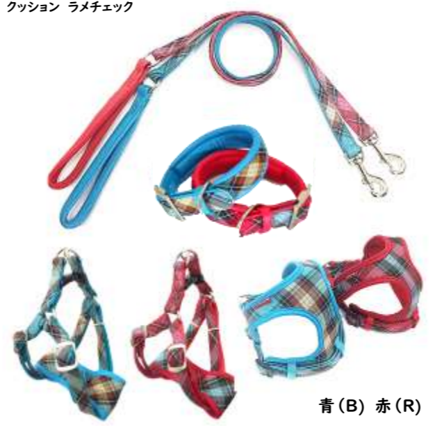
青 (B) 赤 (R)