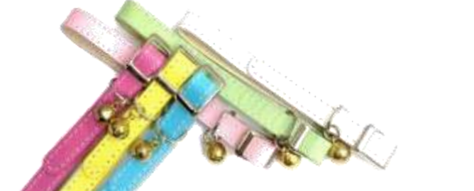
チェリー(CH) スカイ(SK) レモン(LE) ピーチ(PE) ライム(LI) ホワイト(WH)