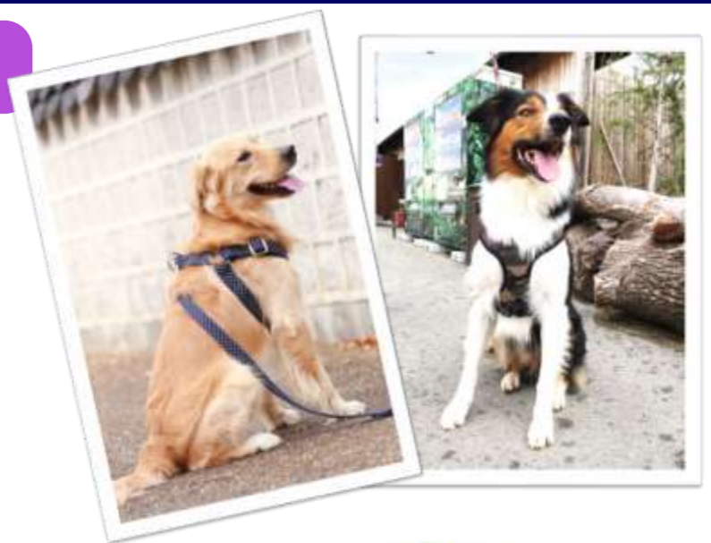
クッション アーミー